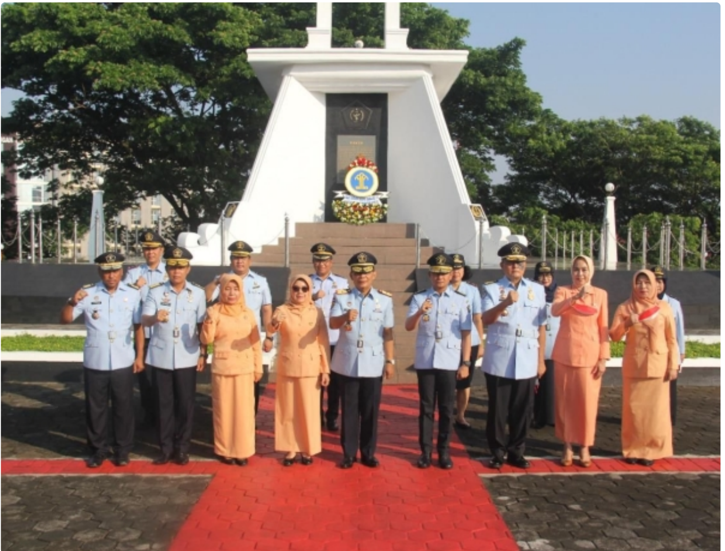
Sambut Hari Dharma Karyadhika Ke-77, Kemenkumham Jateng Gelar Upacara Tabur Bunga di TMP Giri Tunggal

SEMARANG - Bangsa yang besar adalah bangsa yang menghargai jasa para pahlawannya. Atas dasar itu, jajaran Kantor Wilayah Kementerian Hukum dan